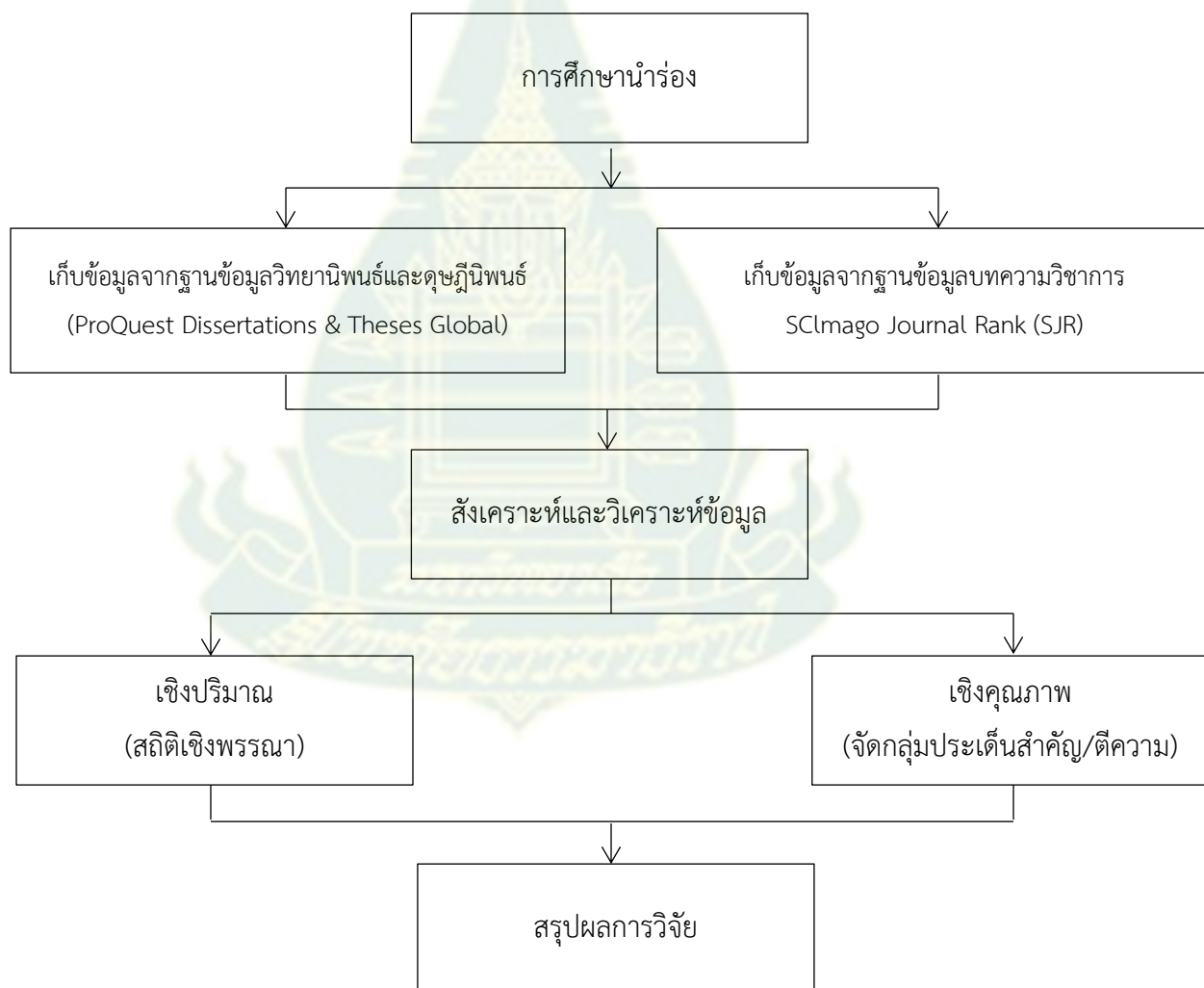
แผนผังที่ 3.1: ขั้นตอนการดำเนินการวิจัย

การวิจัยนี้เป็นการสังเคราะห์งานวิจัย (research synthesis) ของต่างประเทศด้านการบริหารกิจการสื่อสาร เป็นระยะเวลา 10 ปีย้อนหลัง ตั้งแต่ปี พ.ศ. 2551-2560 โดยใช้วิธีการสังเคราะห์ที่ทั้งเชิงปริมาณและเชิงคุณภาพ มีขั้นตอนของการดำเนินการวิจัย ดังนี้ (ดูแผนผังที่ 3.1)